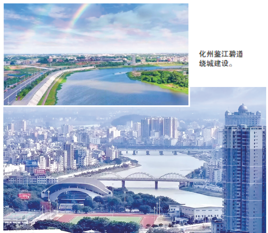
化州鉴江碧道绕城建设。

从一河碧水到满眼新绿,从民生细微处到产业大格局,化州的发展实践印证——有好生态才有好未来。“我们将以更高标准建设生态文明高地,以更高质量推动产业生态化、生态产业化,促进经济社会发展全面绿色转型,加快建设美丽化州。”化州市生态环境部门相关负责人表示。