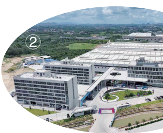
①佛山(茂名)产业转移合作园金山园。 ②广东申菱特种空调和通风设备制造基地。 ③广东中财管道有限公司。

乡贤企业家纷纷点赞家乡发展变化,表达回乡投资、反哺故里的强烈意愿,以乡情为纽带,为春季招商凝聚起浓厚的合作共识、打下坚实的资源基础。