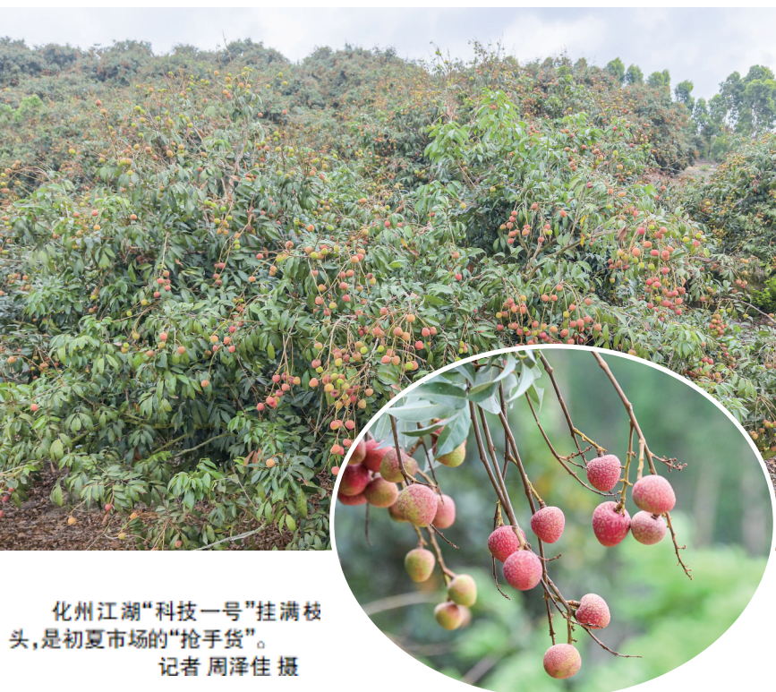
化州江湖“科技一号”挂满枝头,是初夏市场的“抢手货”。

据了解,江湖镇坐拥化州得天独厚的自然禀赋,水土丰饶、光照充足、生态纯净,这里的土壤天然富硒富锗,富含多种对人体有益的微量元素,孕育出兼具优良口感与健康品质的江湖荔枝。目前,全镇荔枝种植规模近7000亩,在镇党委、政府的精心培育与产业布局下,当地依托独特的土壤优势,全力打造集品种优质化、种植标准化、产销一