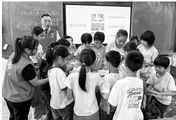
包茂高速志愿者向文胜小学赠予新书籍,孩子们对新书爱不释手。

志愿者们还组织孩子们动手制作创意书签,只见书桌上摆满提前准备的“快乐阅读”主题空白书签、流苏和画笔等多样材料。志愿者们手把手引导孩子们发挥想象力,设计专属书签。稚嫩的笔触在书签上写下“读书破万卷,下