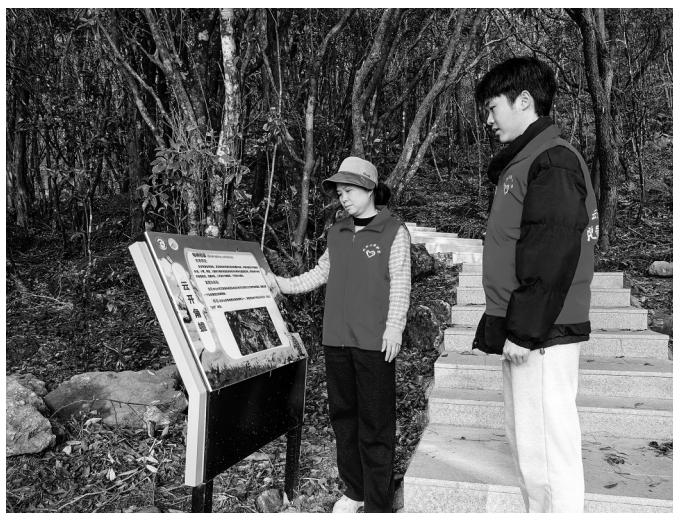
云开山保护区青年干部职工加强重点区域巡查守护森林自然资源生态环境安全。