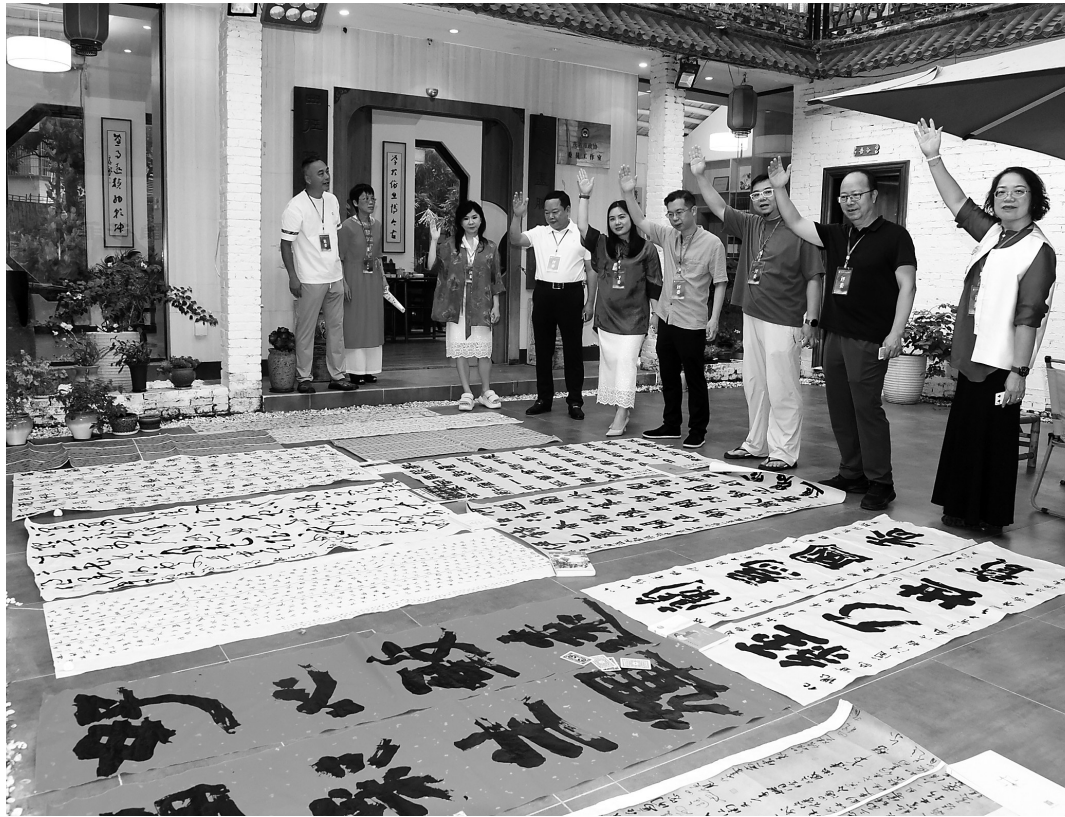
现场评选作品。

据悉,届时所有获奖作品将于5月20日至5月26日在茂名市图书馆集中亮相。展览期间还将编印《2026 茂名市“好心福彩·浪漫之城”暨第五届“一路芳华”全国女子书法作品集》,所有入展作者均将获颁入展荣誉证书及作品集一册。