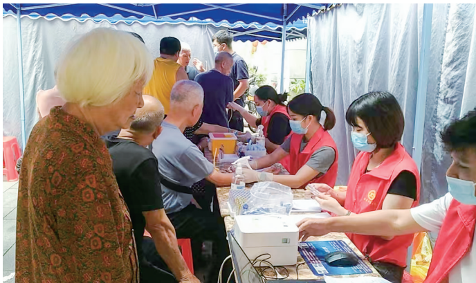
志愿者为社区老人做免费体检。通讯员 丘慧欢 摄

社区公园、街角空地,建成集志愿者招募、培训、激励于一体的综合服务平台;摸索出“党委统筹+党员带头+社工协同+志愿跟进”的长效机制,让服务不是“一阵风”,而是“四季暖”。