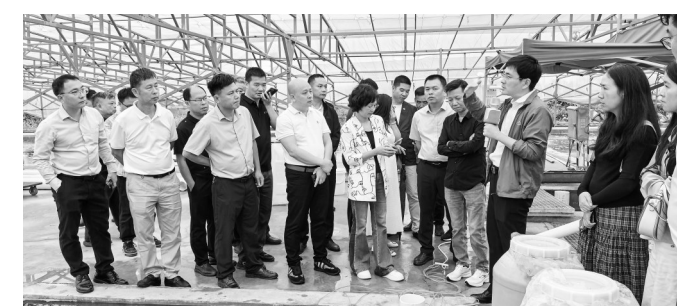
电白区树仔镇党政考察团到珠海考察马鲛鱼项目。

题,旨在通过洗夫人文化传播,加强北部湾城市群的文化交流,让北部湾城市群的市民更加直观具体地了解茂名的文化和风土人情,领略茂名自然风光和丰富的旅游资源,感受茂名经济和文化建设的高速发展,让“好心精神”走进千家万户,让“好心茂名”家喻户晓,共建共筑北部湾文化纽带”为核心主