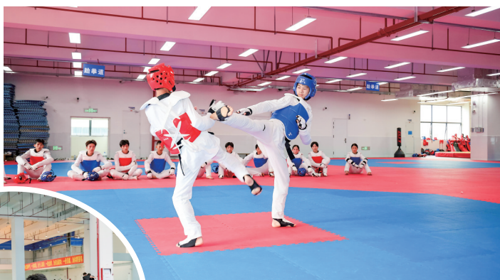
市体校备战省运会训练。