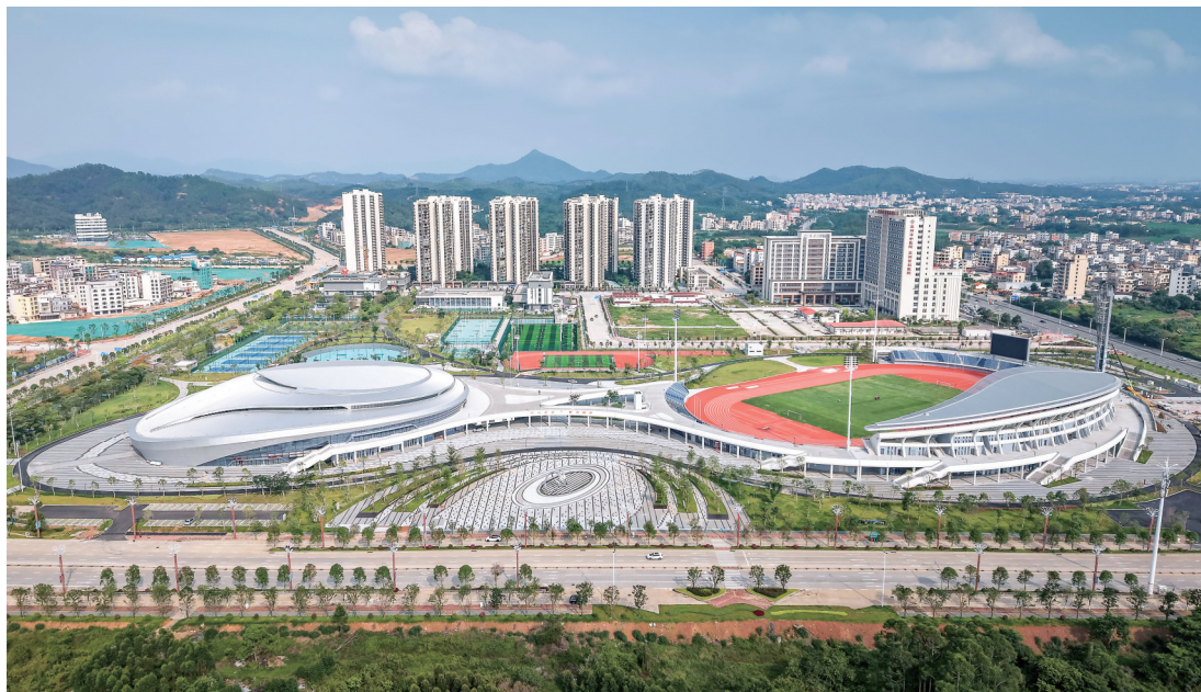
高州体育中心全景。