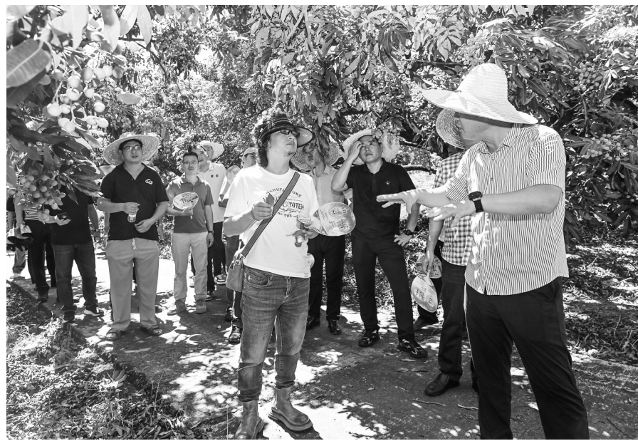
种植户实地观摩绿色种植在储良龙眼种植中的应用成效。记者 周泽佳 摄

茂名市农业科技推广中心农艺师结合本地荔枝、龙眼产业发展现状表示,花生肽肥的落地应用,有力推动了茂名特色农业提质升级。