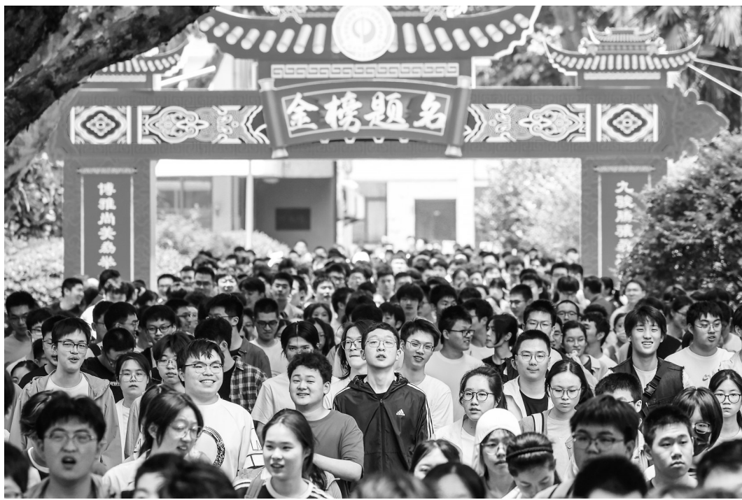
在南京市第九中学考点,考生参加完首场科目考试后走出考场。