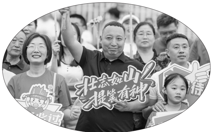
在四川省遂宁市遂宁荣兴东辰学校门口,家长手拿向日葵为考生加油打气。

6月7日,全国高考大幕拉开。伴随语文考试结束,高考作文题迅速引发热议。今年的作文题有哪些特点?折射出语文教育的哪些新趋势?“新华视点”记者采访了多位专家学者和一线语文教育工作者。