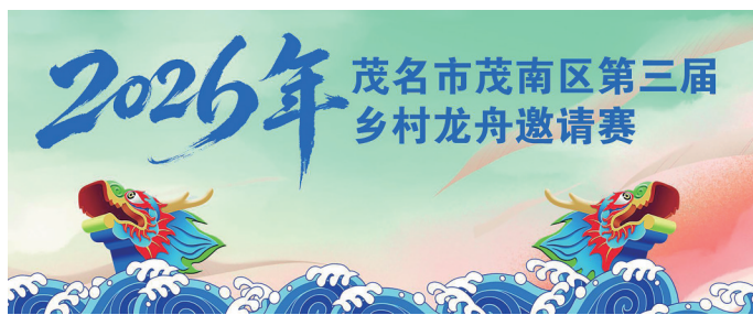
2026年 茂名市茂南区第三届乡村龙舟邀请赛