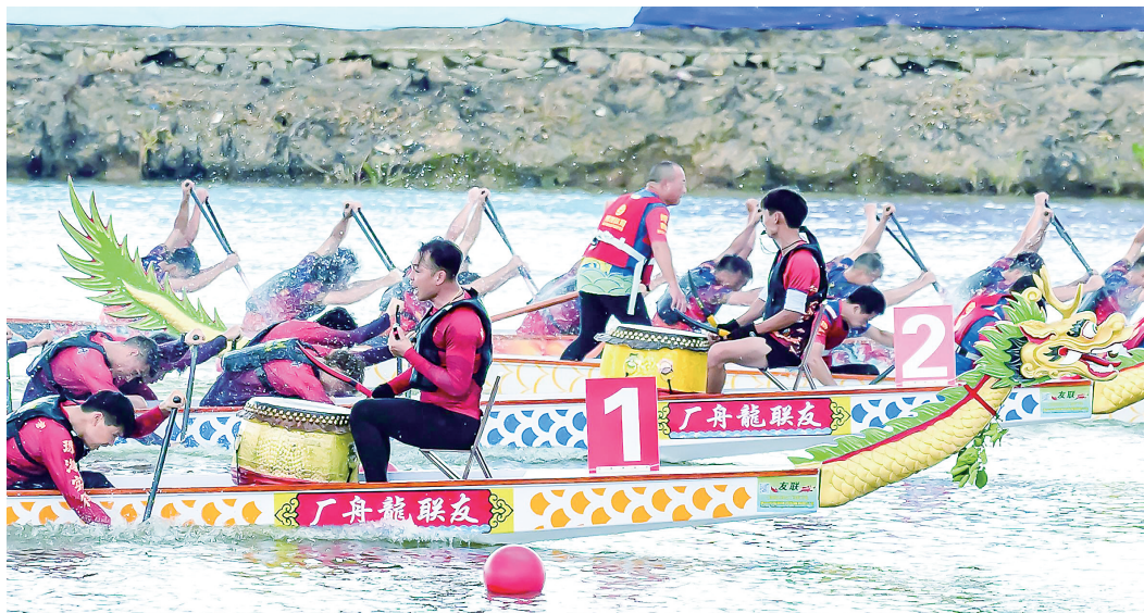
龙舟竞渡袂花江。

赛事主场地设于袂花江林道段,以一江碧水与沿岸城乡风光为天然舞台。作为茂名“母亲河”,近年来袂花江持续推进水安全治理、水生态保护与沿线环境整治,统筹河道清淤、生态补水等工程,为赛事筑牢生态基